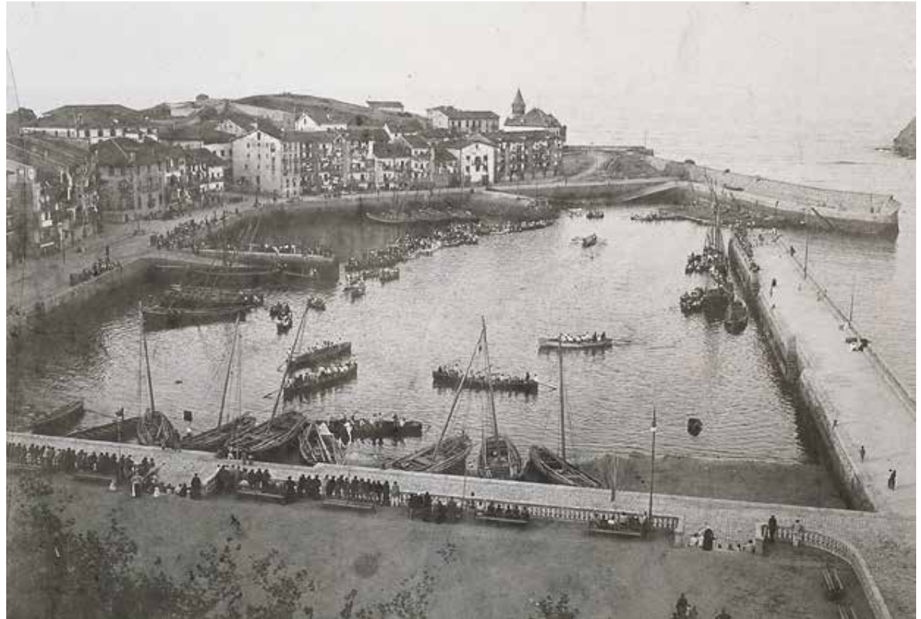
Lekeitioko Antzar Eguna, XX. mendearen hasiera. Herritarrek portuaren inguruan egiten zuten bizitza, bertatik gertu bizi baitziren arrantzale-familia gehienak.

Badaude udalerrriak, arrantzaleak baino bizi ez diren “arrantzaleen auzorik” ez dutenak. Hain zuzen ere, hauxe da portu garrantzizkoenen (Bermeo, Lekeitio, Ondarroa, ...) kasua, biztanlego arrantzalea kale guztietatik hedatzen baita, logikoa denez, portutik hurbilen dauden kaleetan familia arrantzale gehiago bizi bada ere.