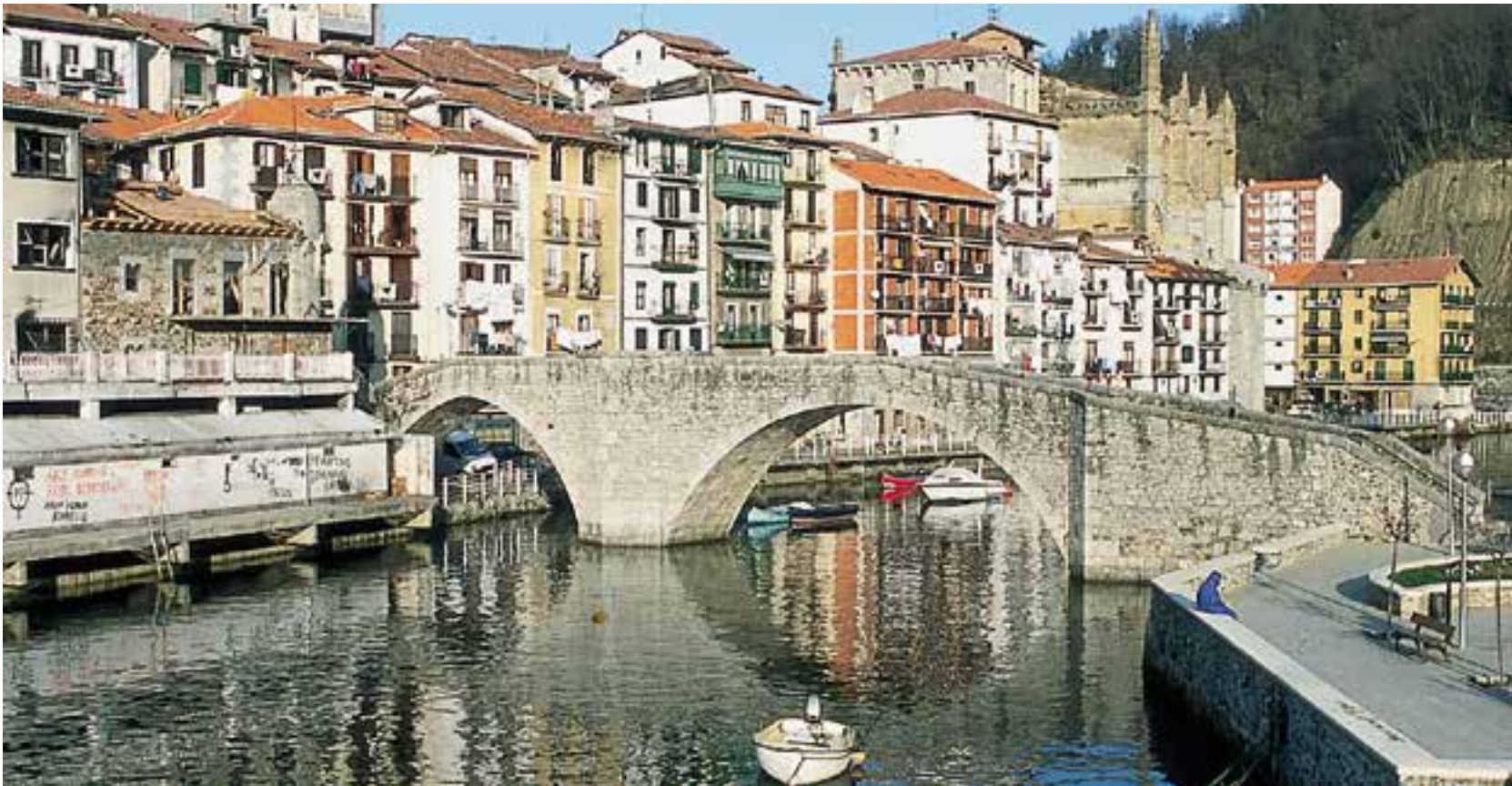
PTE TEXTO Nº 5

behekoenetan), zeren eta harrin "tartekaturik" baitaude. Beheko solairuak, arrantzarako ontzien lanabesak pilatzeko sotoekin, merkatalgune txiki, tailer edo tabernek okupatuta egoten ohi dira. Etxebizitzetara sarbidea, tramu bakarreko edo zig-zag erako aldapa gogorra duen eskailera batez izaten ohi da. Portuetako labarretan dauden etxeetan sarri askotan