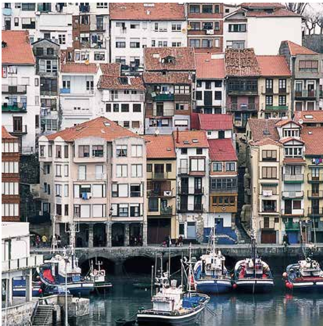
Bermeoko portu zaharra. Arrantzaleen etxeak itsaslabarrean. Leiho eta balkoi ugari begiratokiak dira orain.

Etxearen fatxada, I-H norabidean eraikia, eguerdirantz orientatua da. Teilatua ur bitara da eta, inoiz, banda, fatxadarekin perpedinkularra du, alde honetan ohikoa, parekoa izatea bada ere. Eraikinaren zabalera, lau metro eskasekoa da. Beheko solairua, hiru solairu (altuerako bi metro baino zerbait gehiago dutenak) eta teilatuaren azpiko beste bat du, oso altuera txikikoa izateaz aparte (metro bat baino zerbait gehiago), sarbide bakarra hirugarren solairuko bizitzaren barrualdetik duenez gero, oso gutxi erabili ohi dena.