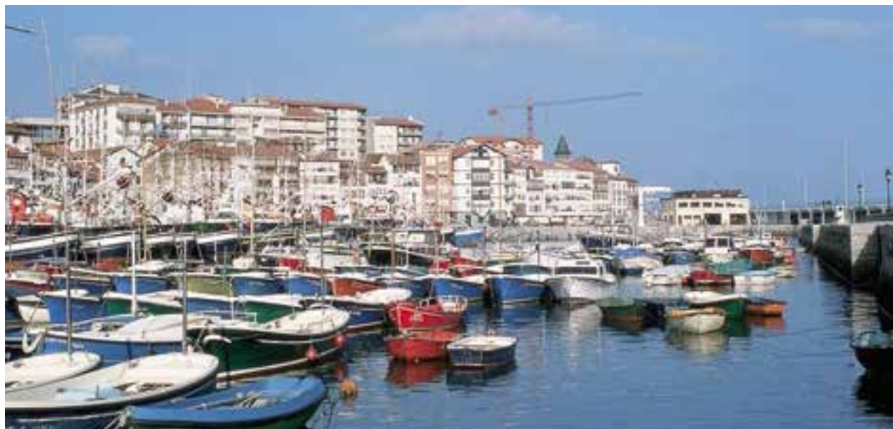
Lekeitioko portua. Lehenengo lerroan, etxebizitza tradizionalak; bigarren planoan, aldiz, eraikuntza modernoak.