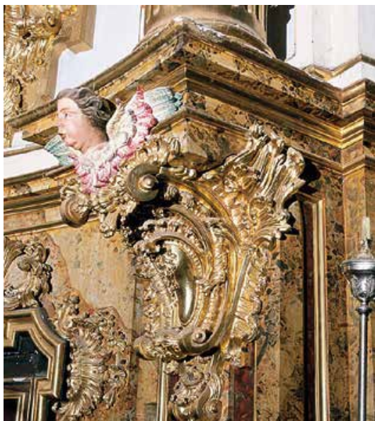
Barroko estiloko erretaula nagusiaren aingerutxo batez aurrez aurre dagoen mentsula baten xehetasuna.

Testu hau idatzi duenak ezin izango du inoiz irakurri. 2000ko abuztuaren 3an hil zen. Gion on eta apaiz pairamentsuaren oroimena uzten digu bizi izan zen arteraino.