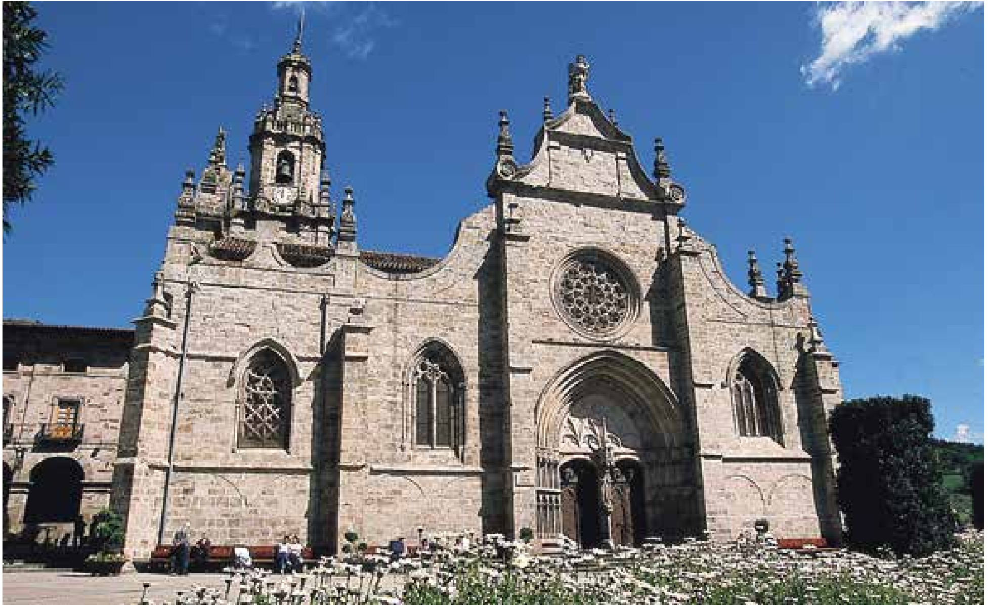
Balmasedako San Seberino eliza. Fatxada monumentala du plazarantz orientatuta. "Gablete" esaten zitzaion XVIII. mendeko dokumentazioan. XVIII gehienak.