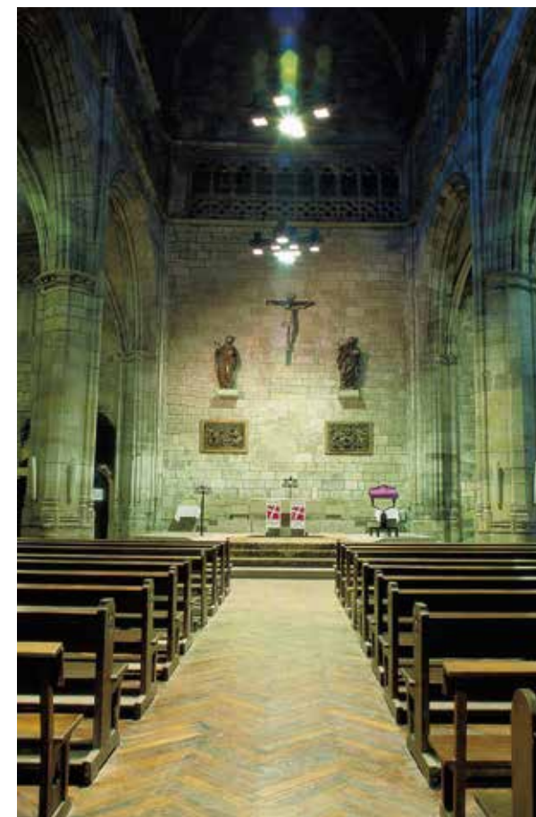
Bilboko San Anton eliza. Gotikoa da eta hiru nabe mailakatu ditu.

Abandoko San Bizente eliza. Zutabe edo hallenkirche motakoa da, zutabeen gainean zarpiatutako hiru nabe ditu.