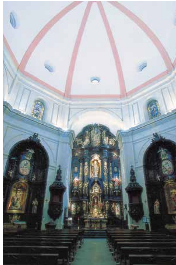
Bilboko San Nikolas eliza. Erdian, kasko kupulaz estalita dagoen espazio handi bat duen eliza da.

Garai guztietakoak ditugu; adibidez, Gure Amaren Jasokundea Ziortzan.