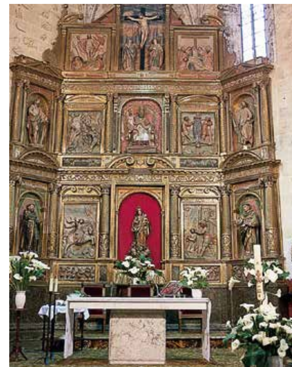
San Pedro eliza (Turtzioz). Vatikanoko II. Kontziliotik aldarea aurreratu eta exentu egin zen. Hemen, XVII. mendeko erretaula eder bat dago.

Pulpitua da predikariak fededunengana jotzen duen lekua. Karelez eta itzuleraz osatuta dago, eta presbiterioan dagoen eta irakurketarako erabiltzen den anboitik bereizi behar da.