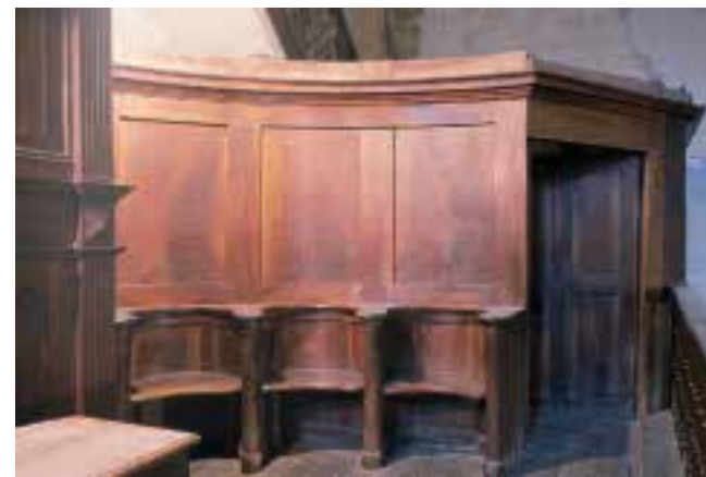
Aulestiko San Joan elizako koruko harlanduaren xehetasuna.