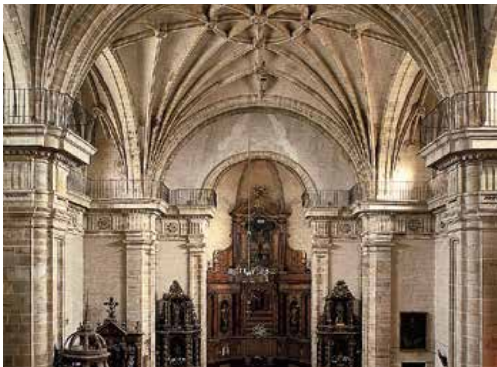
Aldarea dagoen lekua presbiterioa da. Ermuan, esaterako, egurrezko erretaula ikusgarri bat dago, barrokoa, zutabe salomondarrez osatutako egitura duena.

zuten pupitre edo estradoan izan dezake sorrera. Anboia kentzearekin batera, pulpituak sortu zen, eskeko fraideek sustatua, hasieran zerupean egiten zuten predikaziorako erabilia eta azkenean elizara sartu zutena, hobeto entzun ahal izateko nabearen erdian jarriz. Jadanik ez zen "hitzaren" lekua, sermoi eta eliztarren debozioetakoa baizik. Anboia ondo ikusteko eran egon behar da, batzarraren ahal denik eta zatirik handiena bere aurrean izanik. Hobe da bakarra izatea, nahiz eta zenbait