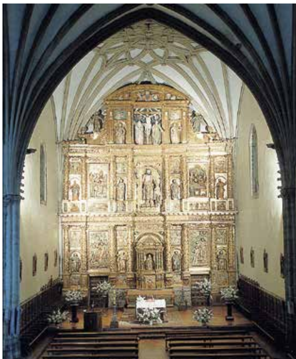
Erretaularen aurrean aldarea dago, aldarearekin, mezatarako. Gordexolako San Juan de Molinar eliza.

eskaintza paganoaren aldare bezala ulertzeko arriskurik. Gainera, zenbait ara pagano, aldare kristau bihurtu izan ziren. Neurriei dagokienean, txikiak dira oraindino (ez dira inoiz metro batetik pasatzen), karratuak eta ogia eta ardaoak eusteko baino ez direnak. Erdi Aroan, aldarearen egiazko izaera galtzen hasten da, Jainkoaren afaria ospatzeko izaera funtzionaleko mahaia izateari utzi eta zenbait gai