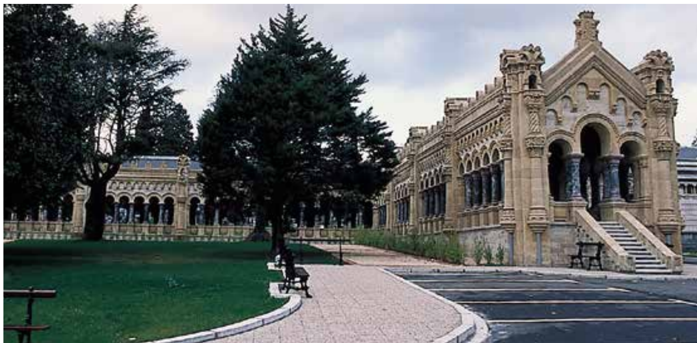
Abadiñoko San Trokaz eliza ikusgarria habearte motakoa da eta estribuen artean kapera altuak ditu, zeinak barrurantz begira dauden. XVIII. mendeko barroko estilokoa da.