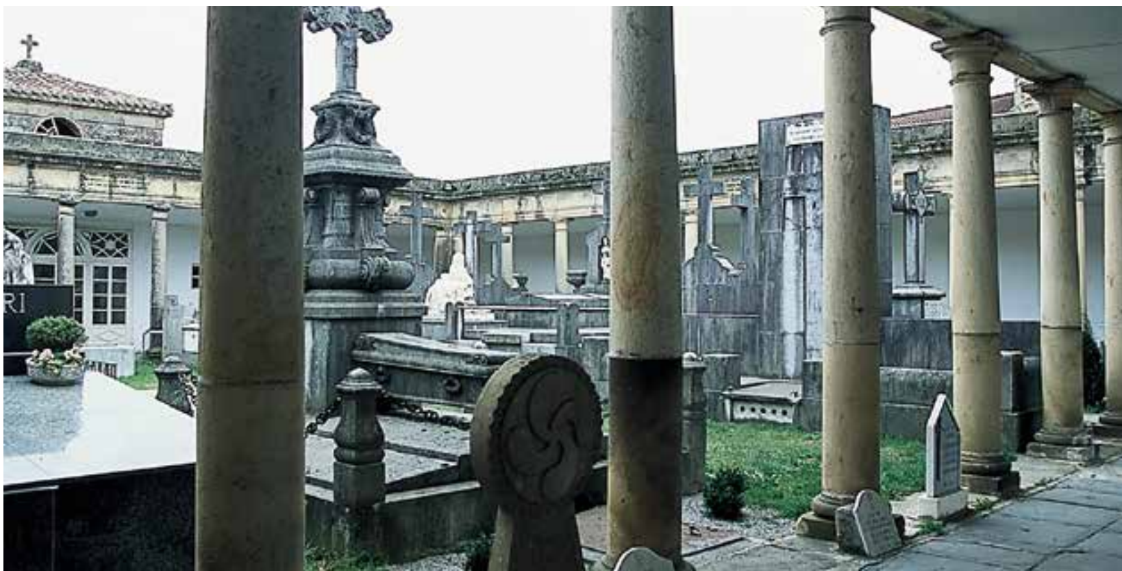
Elizaldeko hilerria (Abadiño). Arkupedun hilerriaren adibide bat era landuan. Loragunea, hasieran garbia, ehorts-lekuez inbaditua izan dela ikusten da.

Kanposantu batean funtsezkoa denaren arteko bat, kapera da. Kanposantu askoren kokapena, aurretiaz baseliza bat bertan izatearen baldintzapean dago (Otxandio, Elorrio, Aldeacueva ...). Bertakoentzat, hilerria baselizaren inguruan egiteak, praktikan, "lur sakratuan" lurperatzeko tradizioarekin jarraitzea