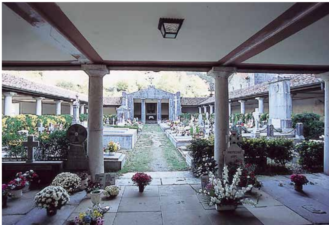
Monumentaltasuna eta soiltasuna dira, Markinako hilerria ondoen definitzen duten ezaugarriak.

arkitekto neoklasikoen hirugarren belaunaldikoa da. Isabeliar aldirian neoklasizismoa zabaldu zutenak ziren. Izan ere, orduan, arabiar, egiptiar edo Mendebaldeko Europan hedatutako erdi aroko berezko proposamenak ere konbinatu edo greziar-erromar neoklasizismoak zabalean hedaturikoak baino nahiago ziren.