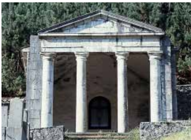
Dimako hilerriko kapera nagusia, tradizio grekolatinoaren eredu bat islatzen, 1841.