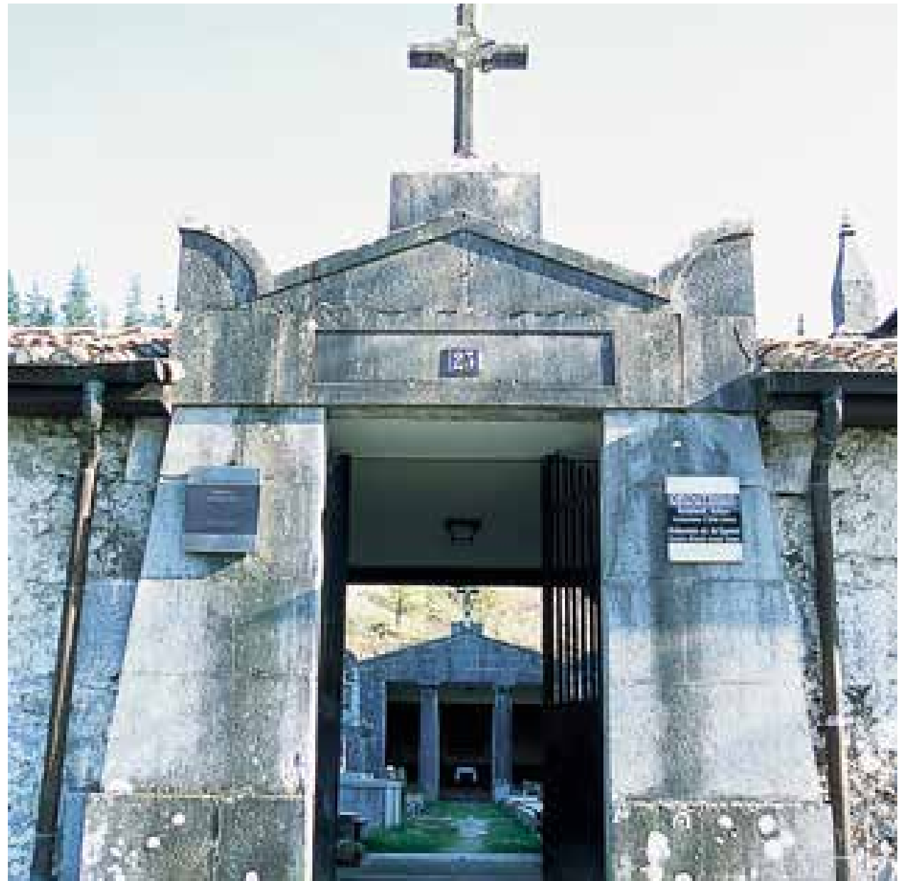
Markinako hilerrira sarbidea, greko-erromatar inspirazioko Neoklasizismoa eta egipziar elementuen arteko sintesi egokia da.

Jasokundeko Andra Mariaren elizako aldameneko batean dago Markina-Xemeingo hilerria, Euskal Herriko kanposantu arkupetuaren adibide argienetariko bat. Kanposantua, 36 x 25 metroko errektangelu bat da, perimetrozko horma batek eta parrokiko Ebanjelioaren aldeko hormapikoak itxi egiten dutela. Markinako harrobietako karezko harlandu gris nabariak egin dago.