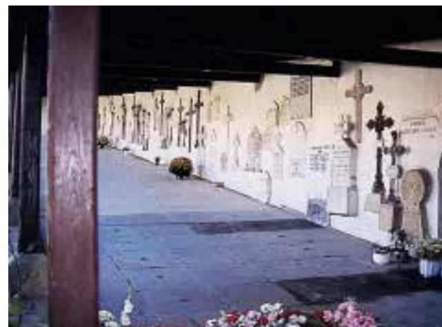
Arkupedun hilerriaren adibide herriko bat, Berrizeko hilerria da, hain berezkoak dituen zurezko oin zuzen eta estaltzeko teilapearekin.