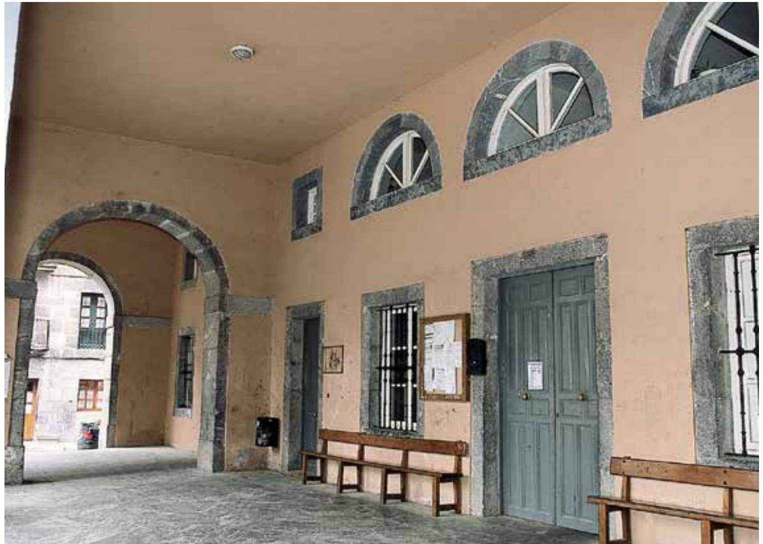
Aulestiko udaletxearen arkupea. Juan Bautista de Belaunzarane 1822an trazaturiko eraikina.

landatarretan bakarrik garatzen da, ezbairik gabe inguruko eraikinek eraginda, funtzionaltasunari garrantzi gehiago emanaz eredu zko eta jendaurreko apaindurazko alderdiei baino. Hala ere, basetxe moten artean hautatua, garatuena da: arkuduna.