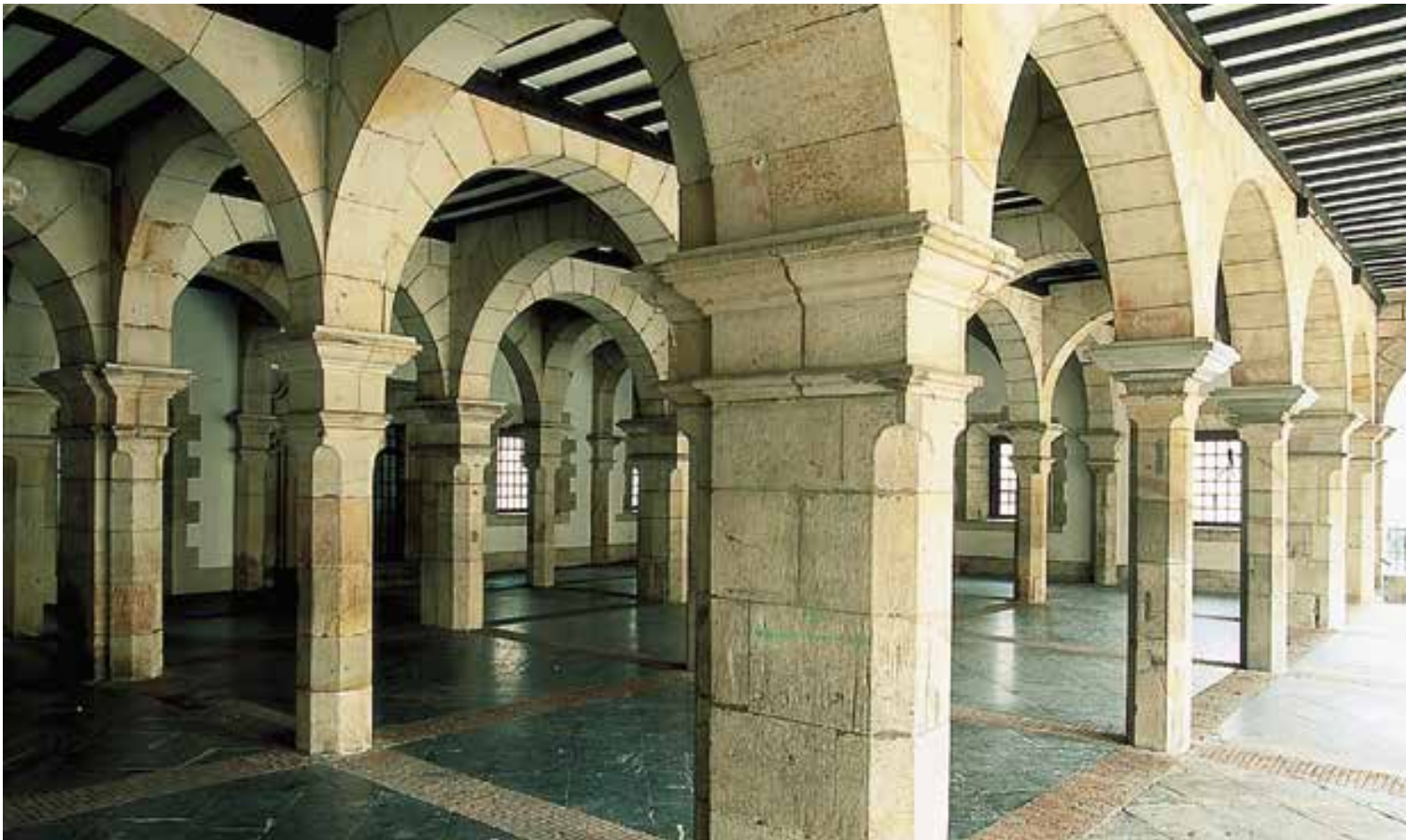
Arkupe bitxia, XX. mendearen hasieran hurrenkeran elkarren segidako bi eraberritzeren emaitza da. Udaletxe enkartatuaren elementu adierazgarriena.

gero eta premiazkoagoa zen zeregin administratiboetarako espazio hedatuago, erosoago eta funtzionalagoak edukitzea. 1734an, kontzejuak, udaletxe eta espetxe berrirako diseinuak eta baldintzak enkargatu eta finantzatzeko beharrezko baliabideak bideratzeko batzorde bat sortu zuen. Urte hartan bertan enkargatu zitzaizkion diseinuak Marcos de Vierna y Pellon menditar arkitekto fidagarriari.