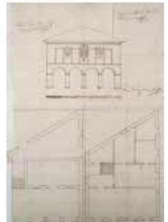
Lekeitioko udaletxearen jatorrizko traza, bitxia izateagatik dokumentu baliotsua, bizkaitar udaletxeen arkitekturaren kontserbatzen diren murrizki bakantetako bat (sinatu gabe).