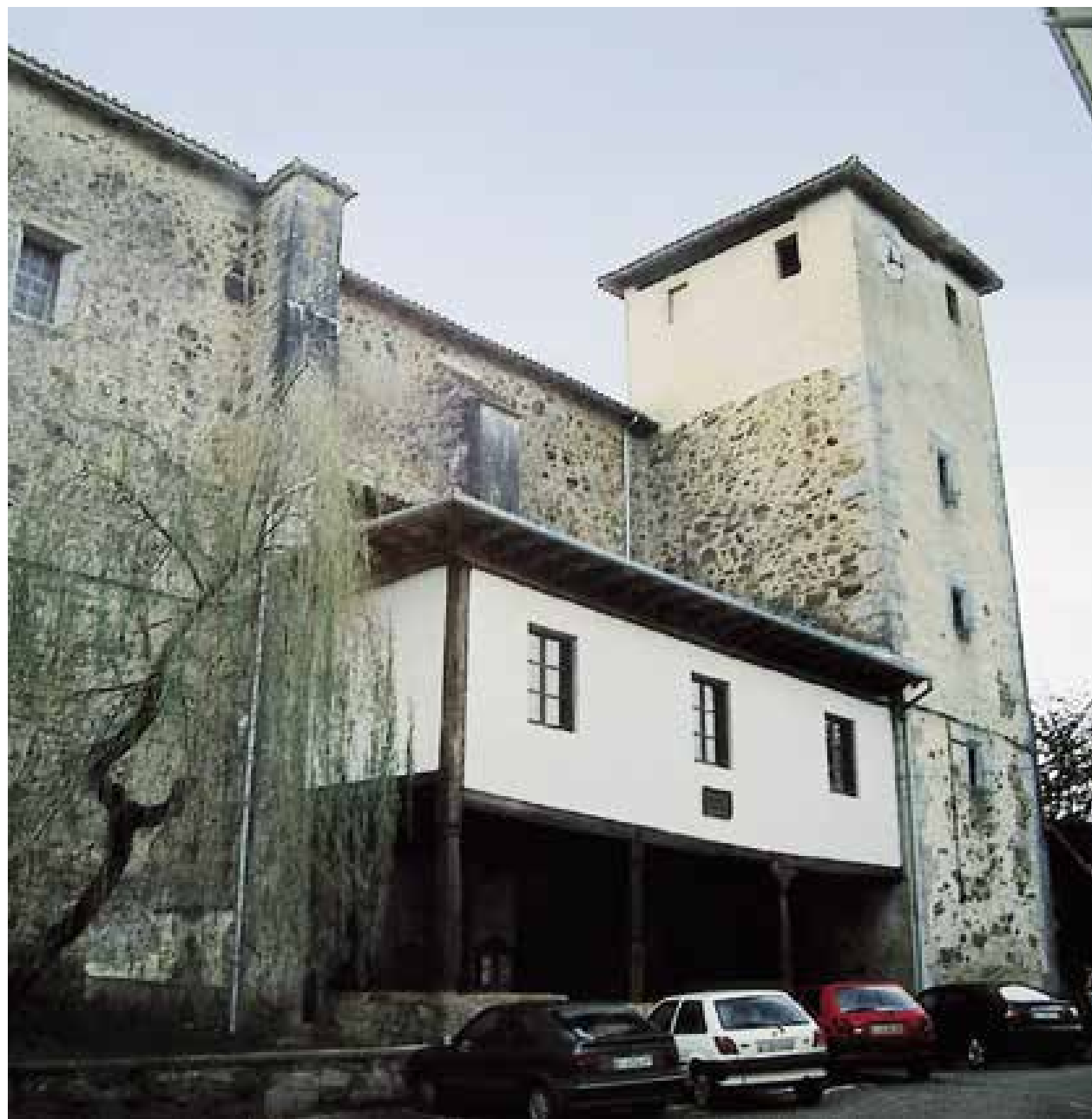
Etxebarria elizateko aintzinako udaletxea. Parrokira atxikitako udaletxeen tipologiakoa. 1700. urte ingurukoa.

Neoklasizismoan zehar, eraikinak, hiru solairutako bolumen handitan eratzen dira. Ataripea da bereizteko elementua