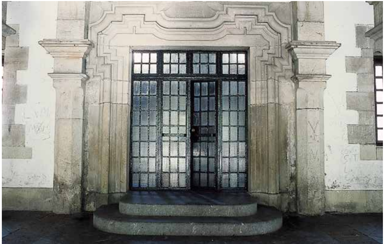
Ate-bao handi bat da eraikineria sarrera, oso lerronahasiak diren orejeta barrokoekin markoztatua.

ulertzen ohi denarekin paregarria: solairu mugituak, argilunen jokua, hormetan zehar sakabanaturiko apaindura e.a. baititu. Hala ere, garaikideen barruan kontestualizatzen baldin badugu, zorrotasun itogarri orokorretik erabat aldendua dela ikusten dugu, joera aurrelaria hartuz.