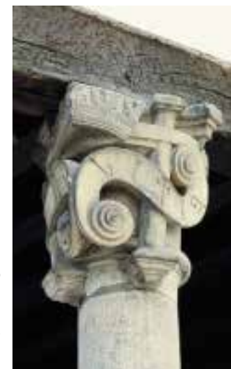
Markinako udaletxearen arkupeko zutabeen arteko baten zehaztasuna. Kapitelean "PLUS ULTRA" irakurtzen da, Carlos V.a enperadoreari oroigarri berandutua.