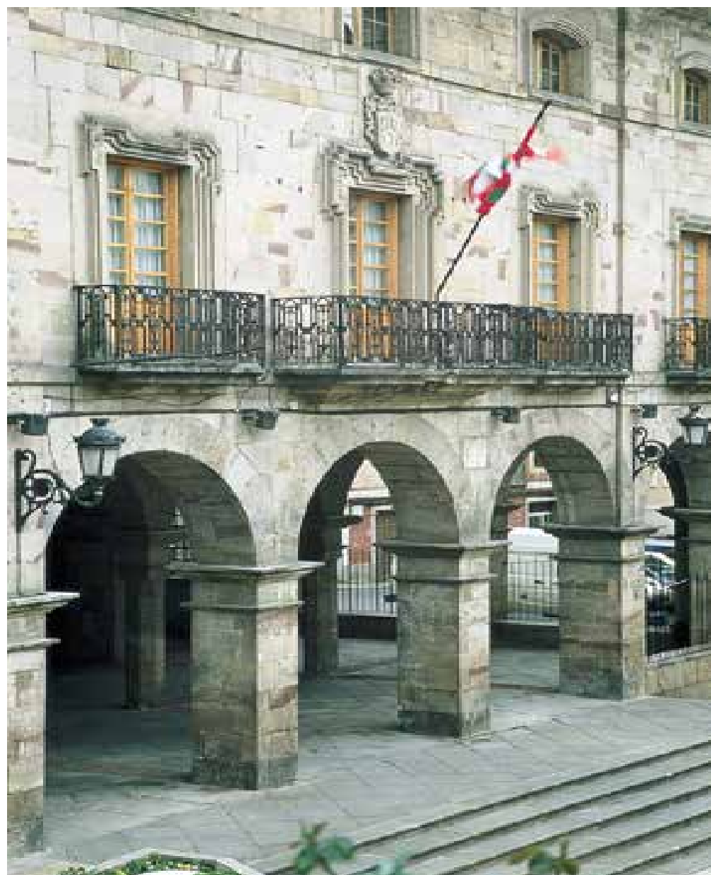
Solairu noblean leihate zabalak daude, oso plaka malkartsutan markoztatuak, zein bere balkoira ateratzen baitira.

Azken solairuak, karpanel arkuan irekitako baoen lerro bat agertzen du, moldura fileteatuek berhesitu izanik. Guztia errematatzen duena, habeburu modernoaren hegale baten oinarri legez balio duen profil konplexuko erlaiza da, lau uretarako teilatuaz estalia.