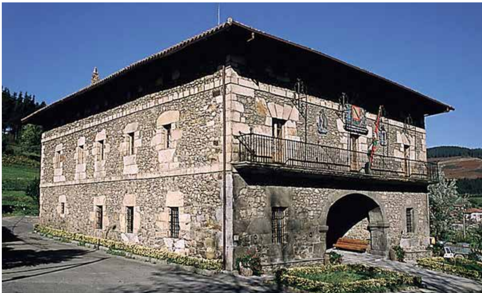
Arrankudiagako udaletxea (1775), atari arku apainelatudun basetxearen eredukoa da.