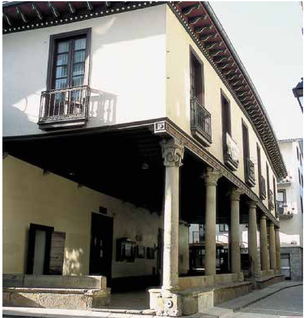
Markinako udaletxea (1521-1542), Errenazimenduan zehar Bizkaian eraiki ziren guztien arteko kontserbatu den zaharrena da.

Bizkaian, udaletxeen sorrera, Errege Katolikoek gobernua garatzen ziharduen zinegotzi-politikarekin zerikusirik estuan dago. Erregeek, kontzejuak batzeko etxe publikoak eraikitzea agintzen zuten (Toledoko Legeak 1480an eta Sevillakoak 1500ean). Honetara, batzar hauek eraikinen askotaritasuna (jabedun etxeak, parrokiako elizpeak...) desagertarazteko saiatzen ziren, Errenazimenduan zehar hedaturiko kultur-postulatu berriak jarraituz, eraikin funtzional erakusgarriak eraikitzeko asmotan. Hori dela eta, Jaureriko lehen adibideak XVI. mendekoak dira: Durango eta Markina, nahiz eta beste batzuk ere eraiki, guztiak desagertuak: Bilbo, Lekeitio, Plentzia, Balmaseda edo Ugao-Miraballes.